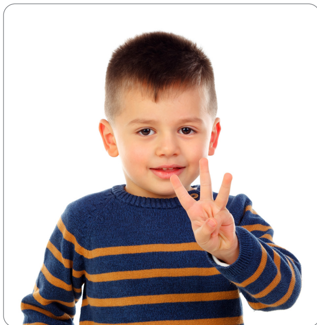
3ተ ነገራትን ሕብርታት ስምን ምቕጻር