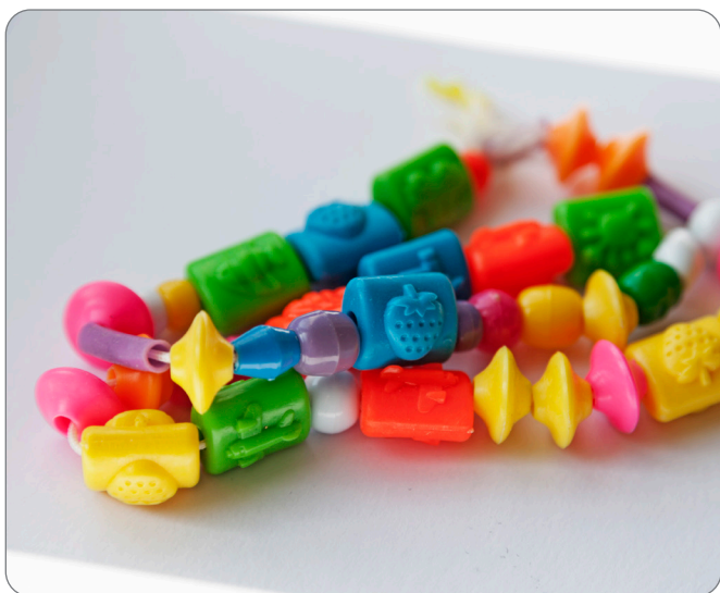
ናይ ገመድ ምትእሰሳር ምልክት